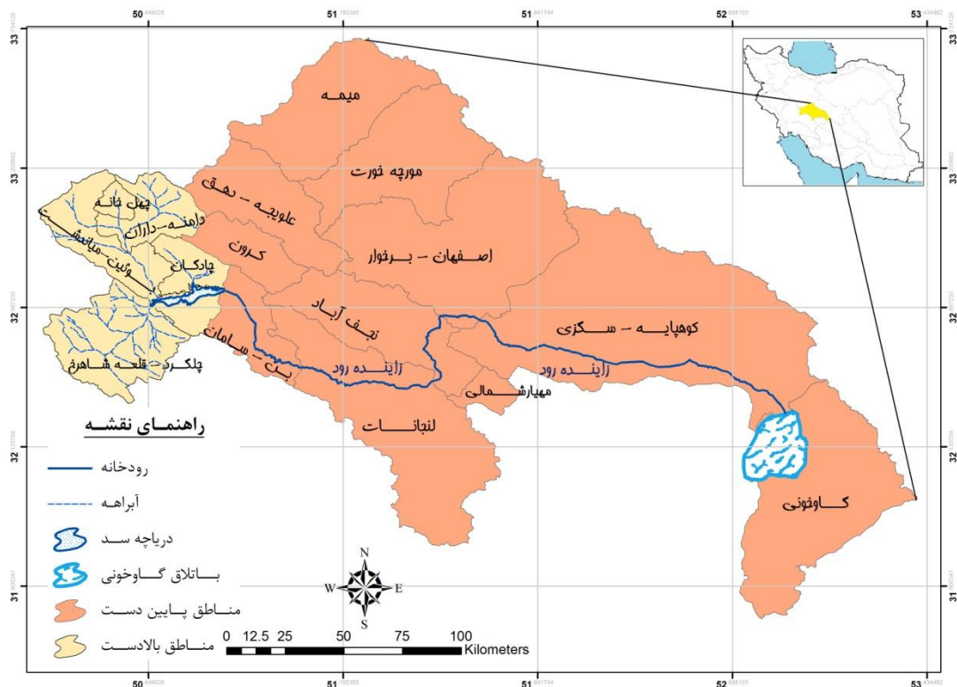
شکل ۲- موقعیت محدوده در بالادست و پایین دست حوضه زاینده‌رود

علاوه بهینه‌سازی، مدل قابلیت محاسبه ارزش اقتصادی آب را نیز دارد. بنابراین روش محاسبه ارزش اقتصادی آب ترکیبی از دو روش برنامه‌ریزی ریاضی غیر خطی و بودجه‌بندی می‌باشد. نتایج ارزش اقتصادی آب در بخش کشاورزی و صنعت برای حوضه زاینده‌رود در جدول ۱ بیان شده است. نتایج حاصل از مدل نشان می‌دهد که ارزش اقتصادی آب در بخش صنعت حدود ۱۴۱ برابر بخش کشاورزی است و این نشان از پتانسیل بالای تولید در بخش صنعت می‌باشد.