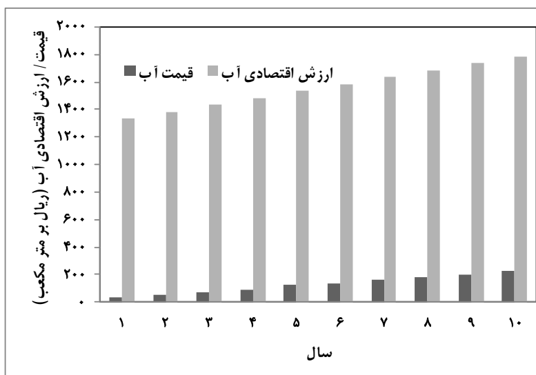
شکل ۴- تغییرات ارزش اقتصادی آب و قیمت آب در سناریوی مدیریتی

مصرف‌کنندگان فشار اقتصادی چندانی وارد نمی‌گردد، بلکه از مقدار سود بیشتری بهره خواهند برد و همچنین هزینه‌های جنبی ناشی از پمپاژ آب کاهش خواهد یافت. در بخش محاسبه ارزش اقتصادی آب مشاهده شد که با افزایش بهره‌وری آب می‌توان ارزش اقتصادی آب را حدود ۱۴ درصد افزایش داد. همچنین دیده شد که در طول دوره برنامه‌ریزی می‌توان به تدریج فاصله بین ارزش اقتصادی آب و قیمت آب را کاهش و پوشش هزینه عرضه آب را بهبود بخشید. همچنین با افزایش راندمان آبیاری و کاهش برداشت آب از منابع، مقدار اتکاپذیری به آبخوان افزایش خواهد یافت.