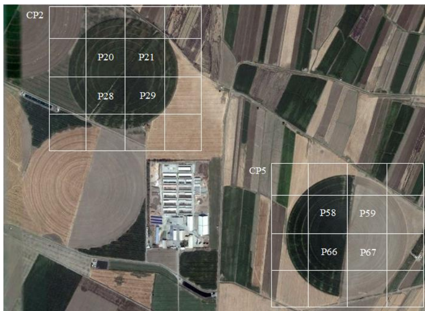
Fig. 1- CP2 and CP5 fields and selected parts for soil moisture measurement (Fallah, 2014) شکل ۱- مزارع CP2 و CP5 و قطعات منتخب برای اندازه‌گیری رطوبت خاک (Fallah, 2014)

سراسر دنیا به منظور ارزیابی سناریوهای آبیاری، شبیه‌سازی و مدیریت شوری خاک، برآورد نوسانات سطح ایستایی، پیش‌بینی عملکرد محصولات مختلف و برآورد اجزای بیلان آب در مقیاس مزرعه‌ای مورد استفاده قرار گرفته که از میان مطالعات متعدد به عنوان نمونه می‌توان به تحقیقات انجام‌شده توسط Noory et al. (2011)، Bennett et al. (2013)، Ma et al. (2015)، Badihneshtin et al. (2015)، Kumar et al. (2015) و Hassani et al. (2016) اشاره کرد. در مدل SWAP، جریان عمودی آب در خاک با استفاده از معادله یک‌بعدی ریچاردز توصیف می‌شود. این معادله که از تلفیق معادله بقای جرم و معادله داری در شرایط غیراشباع به دست می‌آید به صورت زیر نوشته می‌شود: